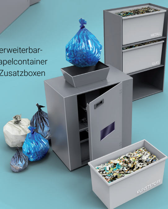
Mx20 erweiterbar mit Stapelcontainer und 2 Zusatzboxen