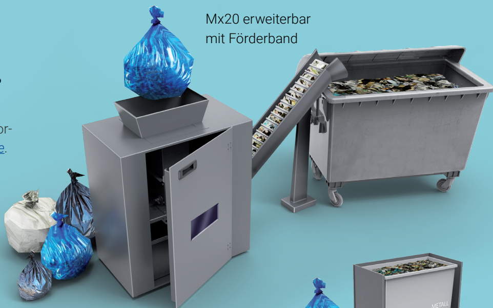
Mx20 erweiterbar mit Förderband

Wir präsentieren Ihnen gerne unser Multitalent vor Ort und informieren Sie ausführlich über Ihre persönlichen Vorteile.